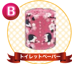
トイレットペーパー