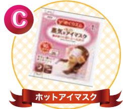
ホットアイマスク

※掲載写真はイメージです。品切れの際は他の商品に代えさせていただきます。※商品がなくなり次第終了となります。