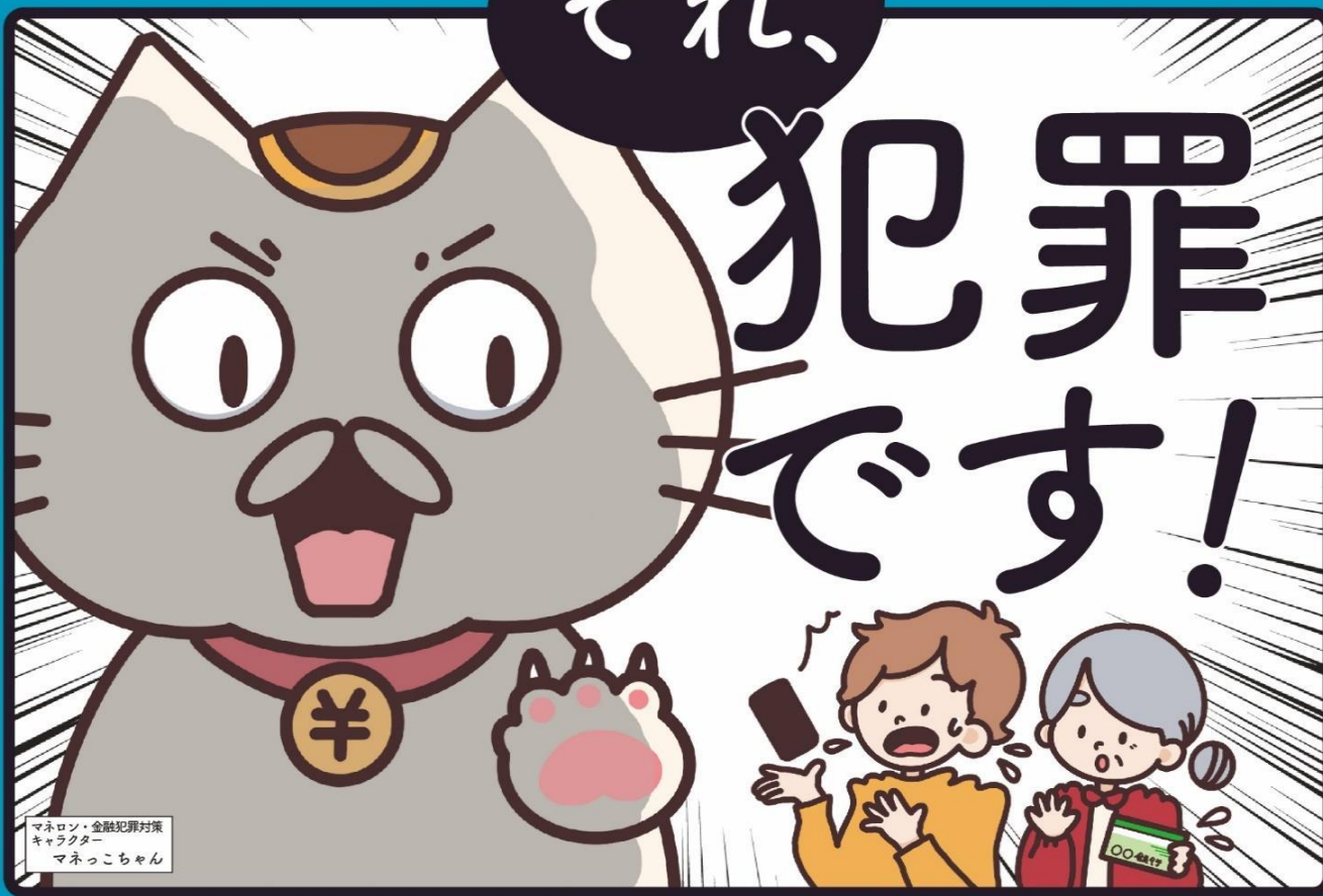
マネロン・金融犯罪対策 キャラクター マネっこちゃん